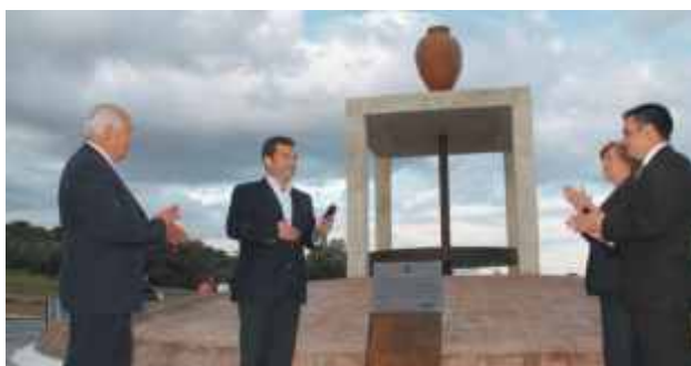
Inauguração da escultura em homenagem aos oleiros e ao Centro Oleiro de S. Pedro do Corval