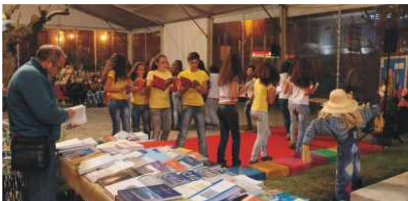
Danças com Livros