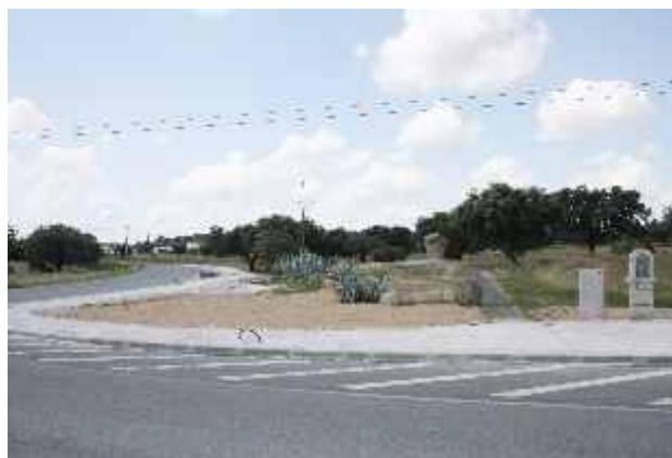
Construção de passeios, iluminação pública e limpeza da zona envolvente