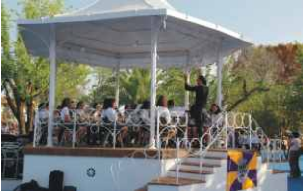
Banda da Sociedade Filarmónica Harmonia Reguenguense