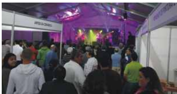
Espectáculos musicais enchem Pavilhão da Olaria e do Barro