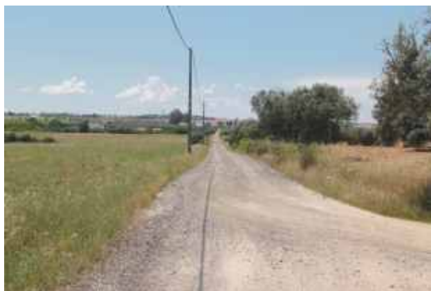
Reguengos de Monsaraz - Coutada