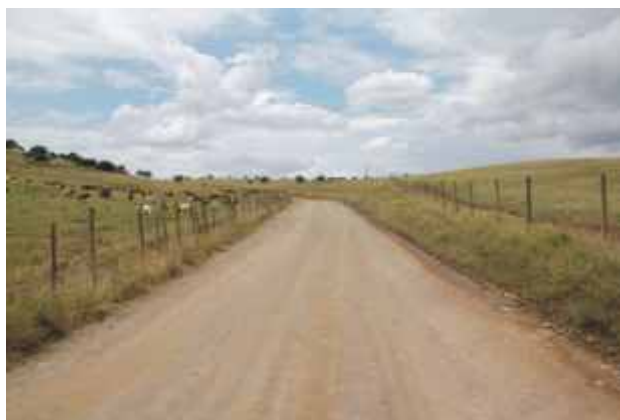
Monsaraz - Machoa