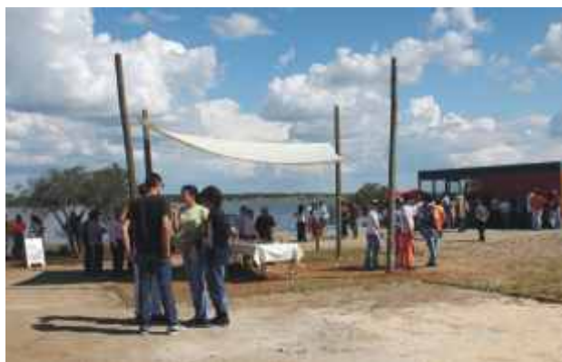
“Festa de Abril” no Centro Náutico de Monsaraz