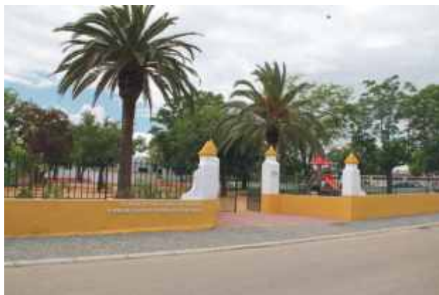
Colocação de “lettering” alusivo ao Centro Oleiro de S. Pedro do Corval e pintura geral