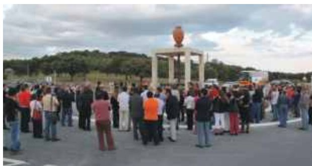
Escultura representa uma Roda de Oleiro coroada por uma talha