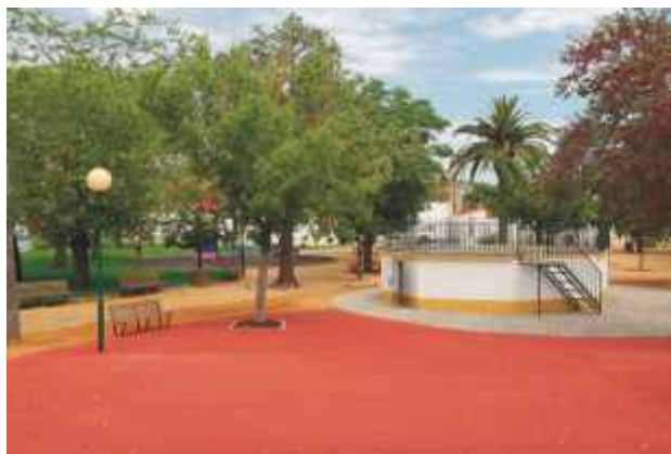
Pavimentação em betão poroso