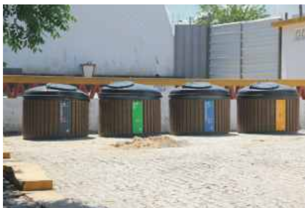
Colocação de ecopontos com contentores enterrados