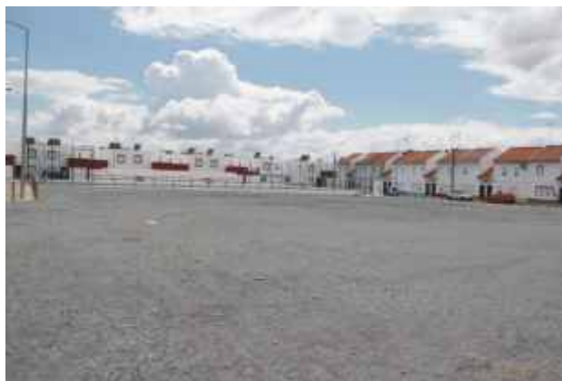
Regularização e criação de sistema de drenagem no largo