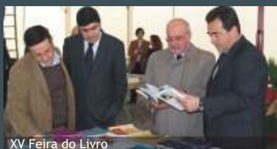
XV Feira do Livro