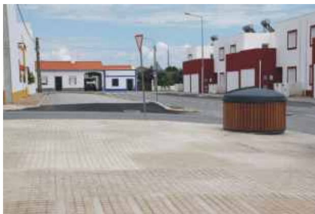
Colocação de contentores de RSU enterrados e rampa de acesso