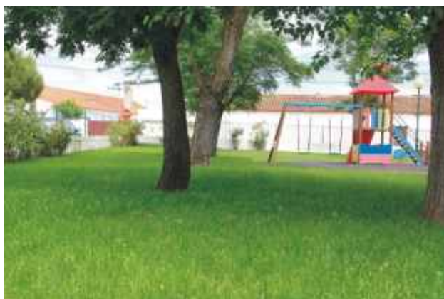
Instalação de sistema de rega, plantação de árvores e arbustos e sementeira de prado