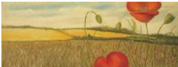
“Um Olhar na Paisagem”