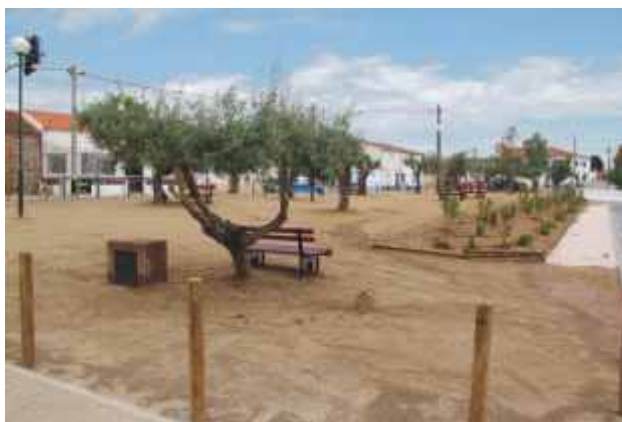
Criação de zona de estadia com plantação de árvores e arbustos, instalação de sistema de rega e colocação de mobiliário urbano