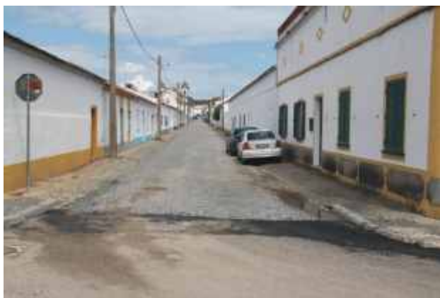
Regularização do pavimento