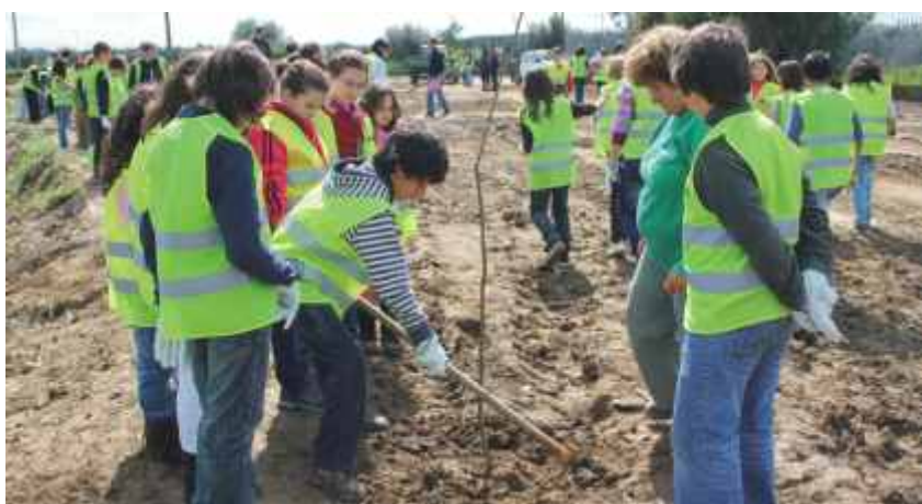
Crianças plantaram árvores

dezenas de pessoas partiram da Praça da Liberdade e foram limpar lixeiras clandestinas, tendo sido recolhidas 2,6 toneladas de resíduos.