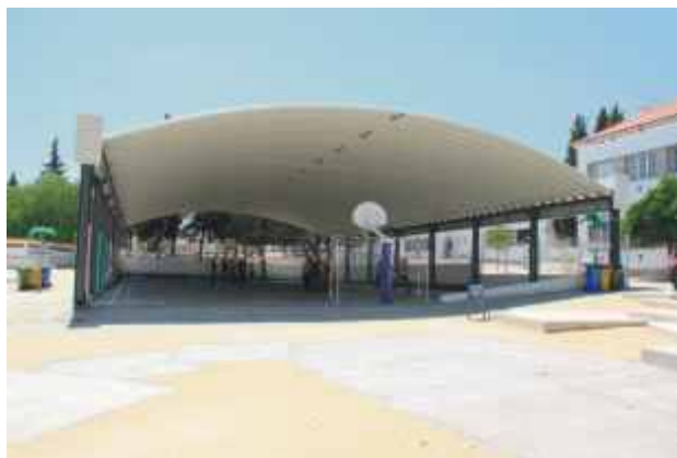
Cobertura e pavimentação do campo de jogos