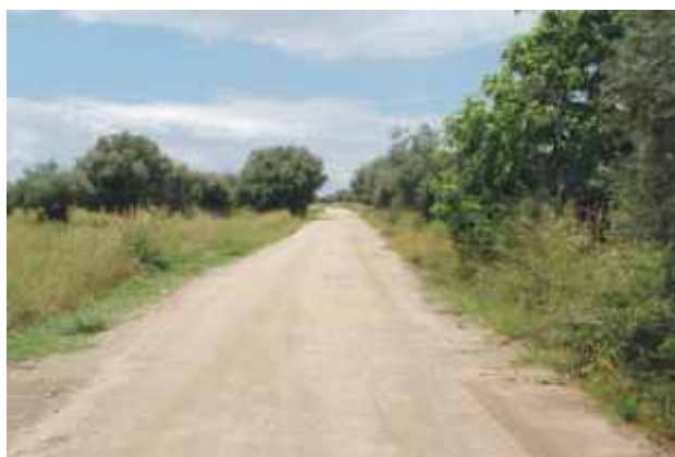
Barrada - Estrada dos Reboredos