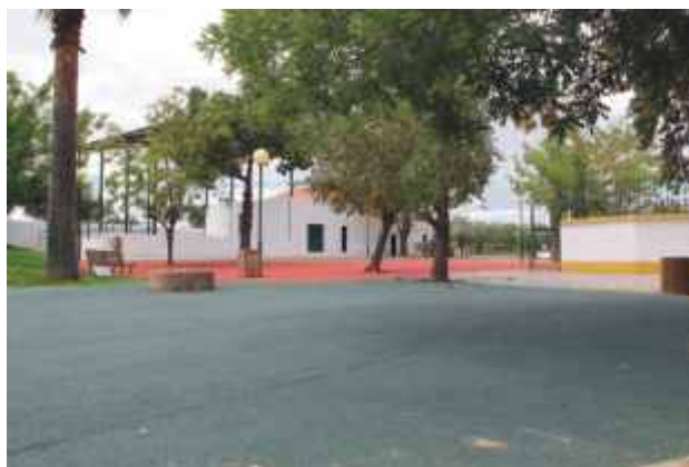
Construção de camarins e rampa de acesso ao palco