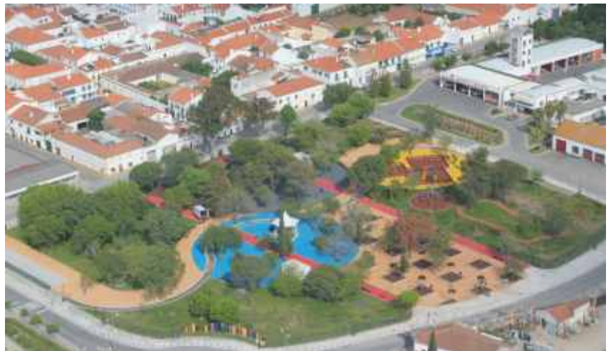
A água faz a ligação entre os vários núcleos do Parque da Cidade

começou a trabalhar na Câmara Municipal de Reguengos de Monsaraz em 1952, passando a desempenhar as funções de jardineiro a partir de 1966 com a conclusão das obras do jardim municipal, em cuja concepção e construção participou activamente. Durante duas décadas cuidou do jardim, até se reformar em 1985.