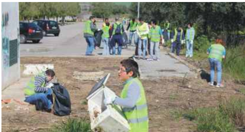
Limpeza de lixeiras clandestinas