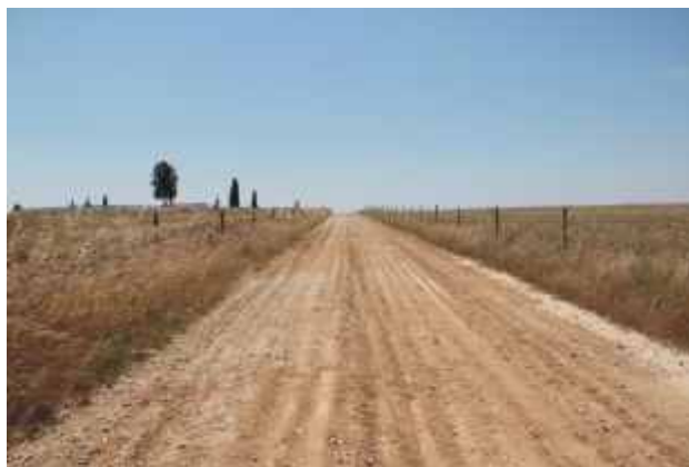
Estrada dos Albardeiros (Caminho rural)