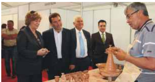
A arte da olaria ao vivo na FIOBAR