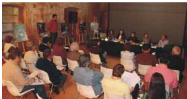
Jornadas Ibéricas da Olaria e Cerâmica