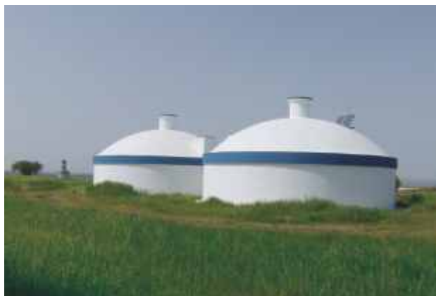
Restauro e impermeabilização interna e externa do reservatório e respectiva pintura e integração na rede de telegestão de abastecimento em baixa