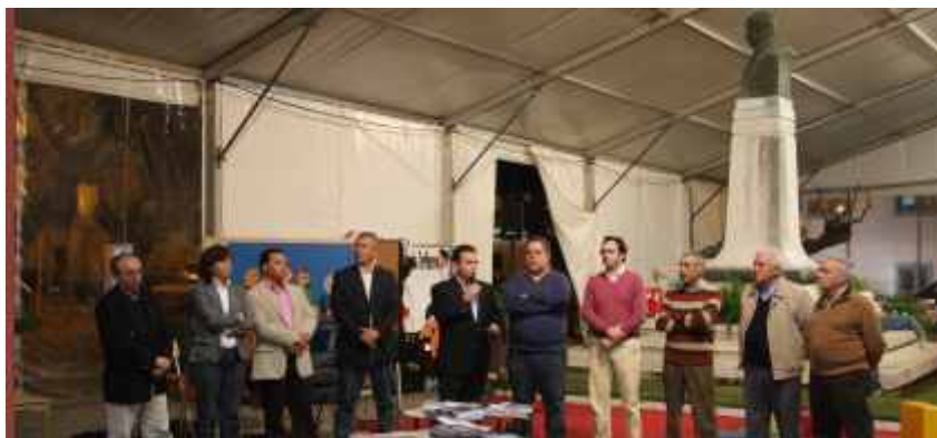
Cerimónia de abertura da 15.ª Feira do Livro