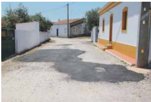
Regularização do pavimento na Rua do Monte Arriba