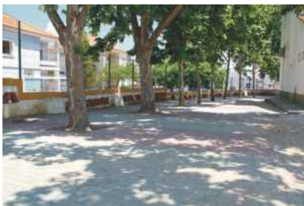
Pavimentação da zona de recreio