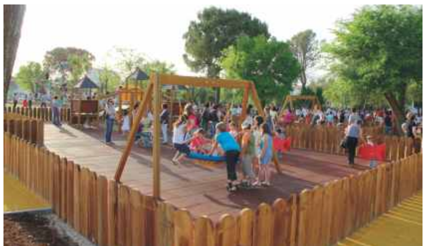
Crianças divertiram-se no novo parque infantil