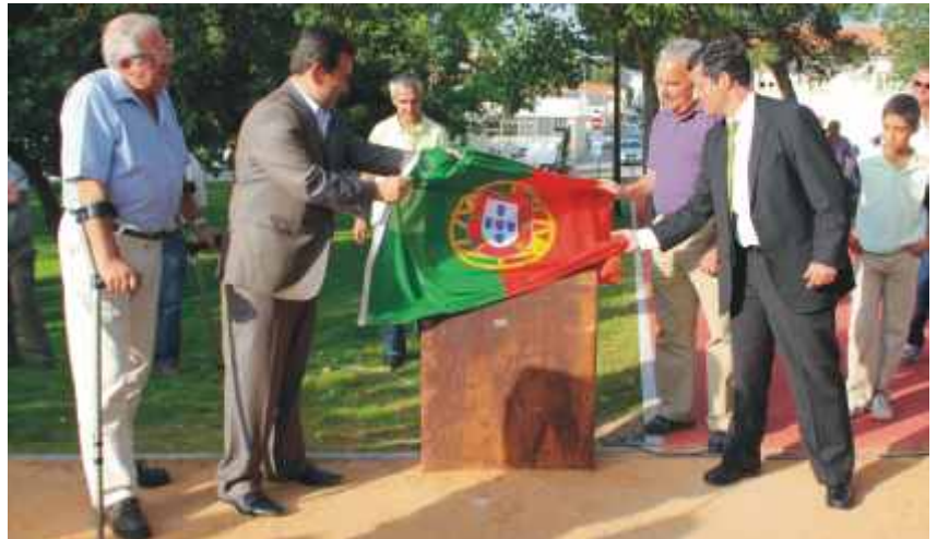
Cerimónia de inauguração