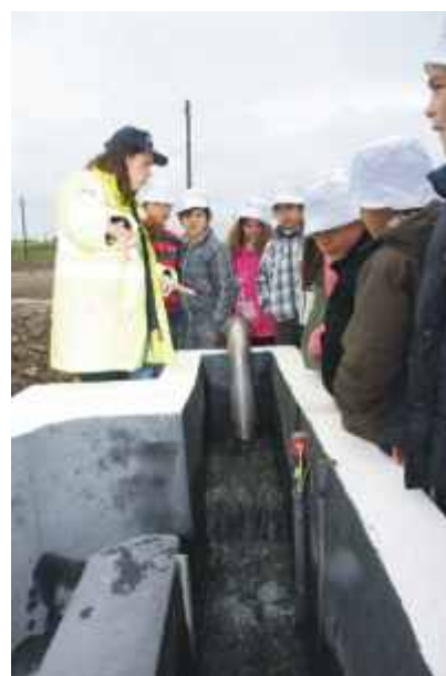
Visita às ETAR

Básica Integrada, que consistiu no apadrinhamento de árvores no Parque da Cidade, tendo as crianças dos estabelecimentos de ensino das freguesias rurais participado nesta acção nos dias 2 e 3 de Maio. No âmbito desta actividade, as escolas do concelho foram convidadas a promover um trabalho sobre as diferentes espécies de árvores apadrinhadas, elaborando um logótipo alusivo à árvore que está registado numa placa junto a cada exemplar arbóreo como forma de assinalar o seu apadrinhamento. Esta foi também uma forma de co-responsabilizar as escolas e os alunos pelo crescimento e protecção das árvores apadrinhadas. ■