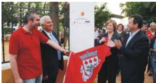
Inauguração da requalificação do Jardim Público de S. Pedro do Corval