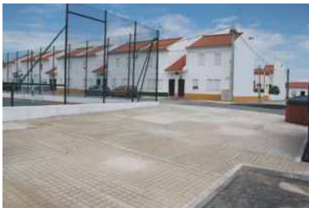
Construção de passeios