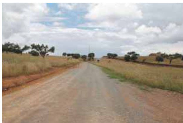
Monsaraz - Courelas da Machoa