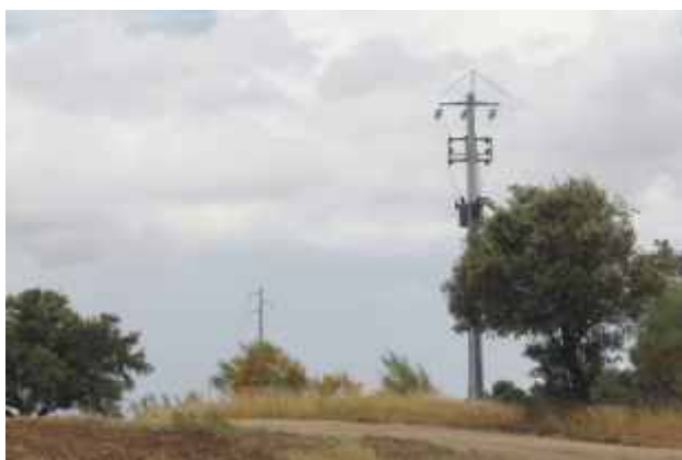
Electrificação do Centro Náutico de Monsaraz