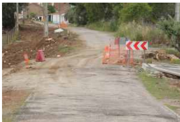
Obras do CM1124-2