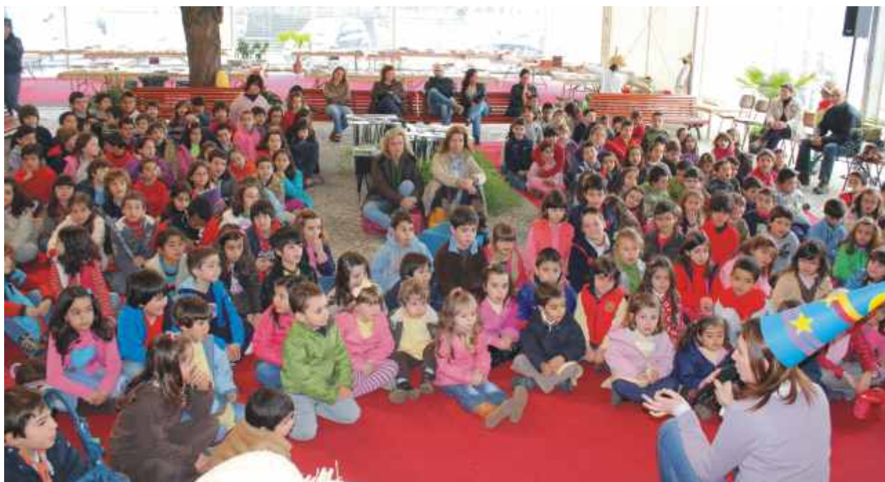
Crianças ouvem atentamente os contadores de histórias