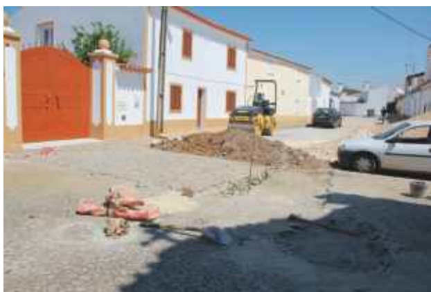
Reabilitação da entrada e melhoramento da calçada do Largo da Igreja