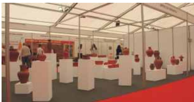
Exposição Artes da Cerâmica