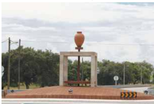
Instalação de monumento de homenagem aos oleiros e Centro Oleiro de S. Pedro do Corval