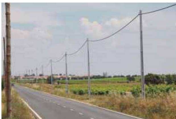
Electrificação Rural - estrada de Reguengos-Perolivas