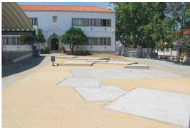
Área do Anfiteatro Informal com pavimentação da zona envolvente