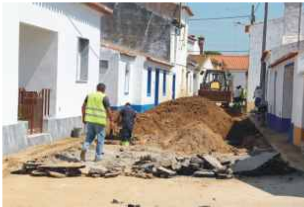
Construção da rede pluvial e pavimentação da Rua da Liberdade