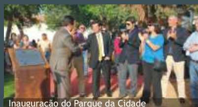
Inauguração do Parque da Cidade

Governadora Civil do Distrito de Évora, Fernanda Ramos