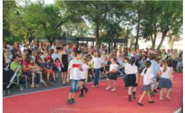
Coro Infantil da Sociedade Artística Reguenguense