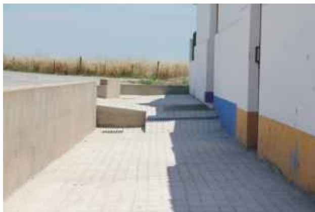
Requalificação de passeios no Bairro Amélia Rojão