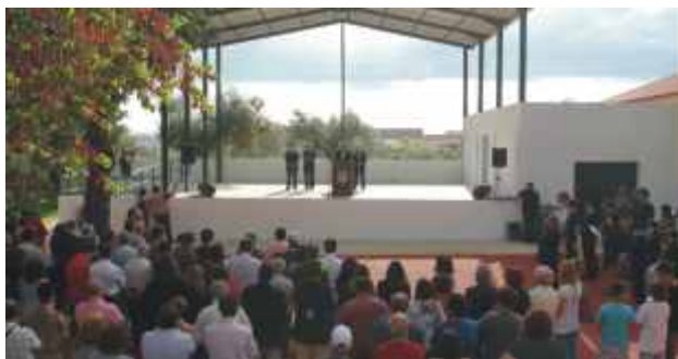
Abertura da Festa Ibérica da Olaria e do Barro