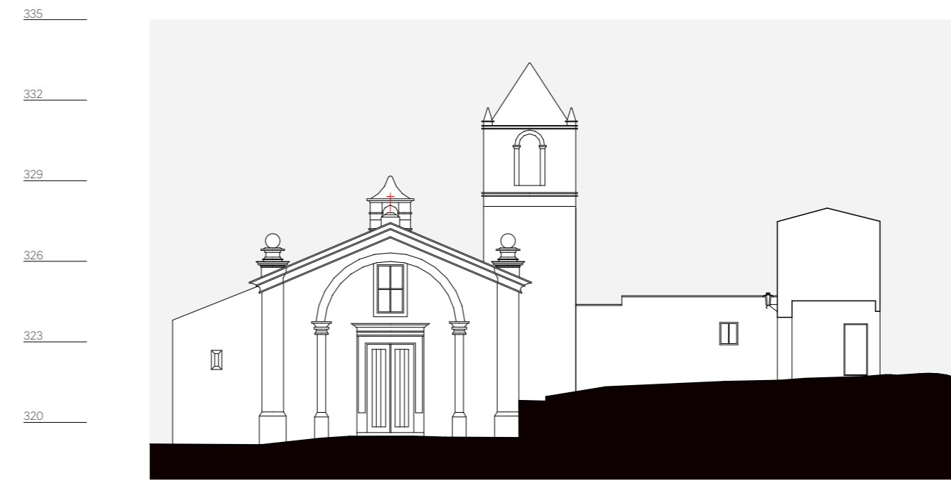
quarteirão H, alçado 2, adro igreja de santiago n. 2