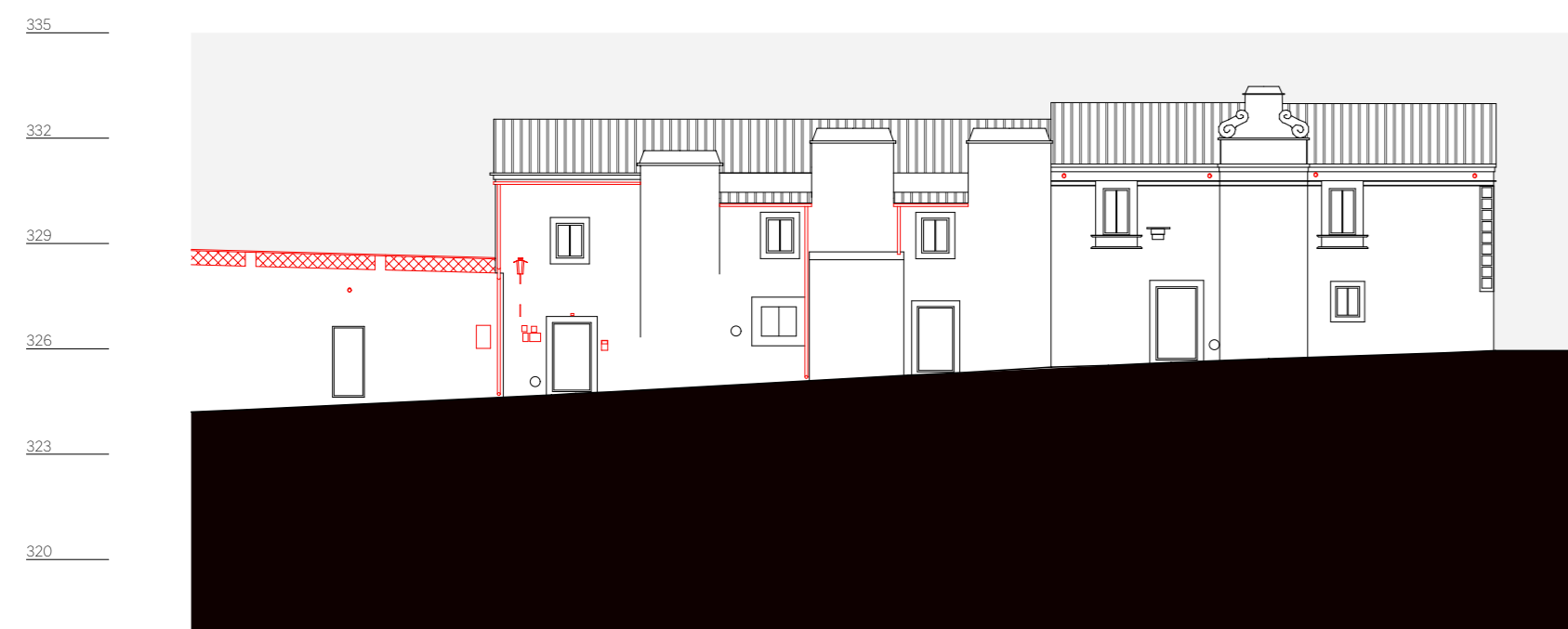
quarteirão H, alçado 3, rua direita n. 11 a 21