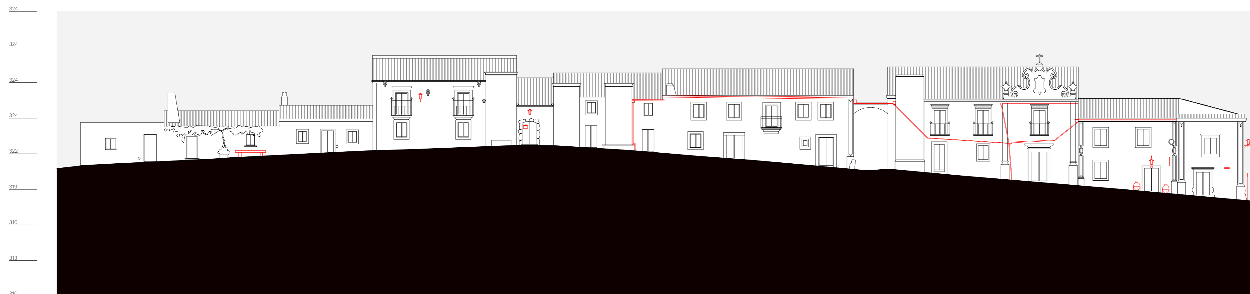
quarteirão K, alçado 4, rua José Fernandes Caieiro n. 2 a 12