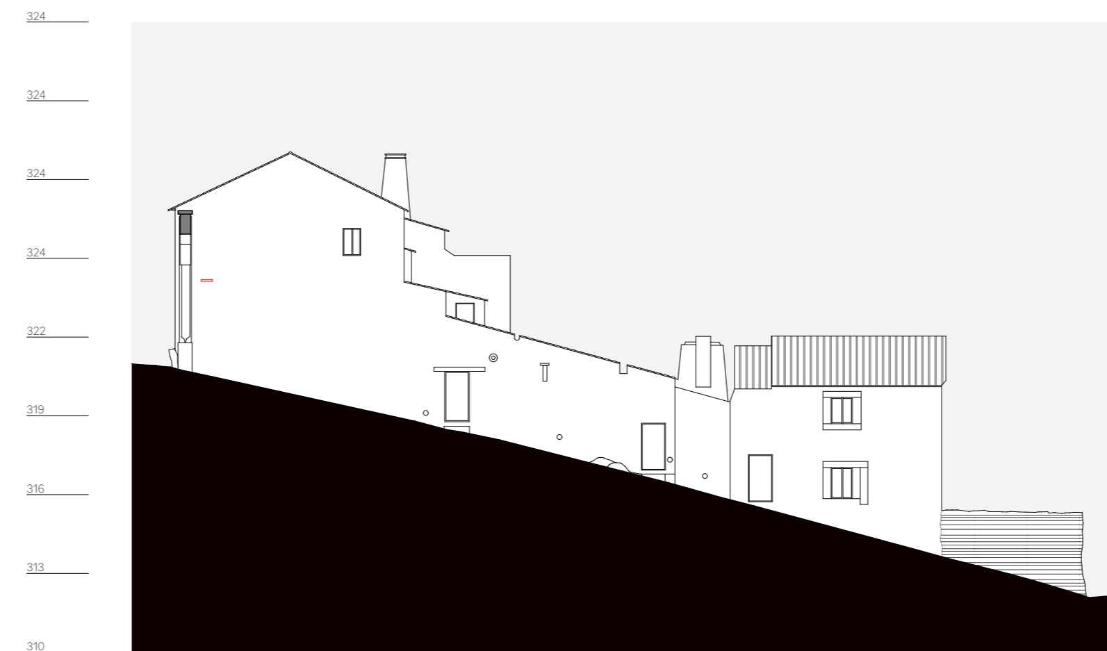
quarteirão K, alçado 3, travessa da misericórdia n. 1 a 5