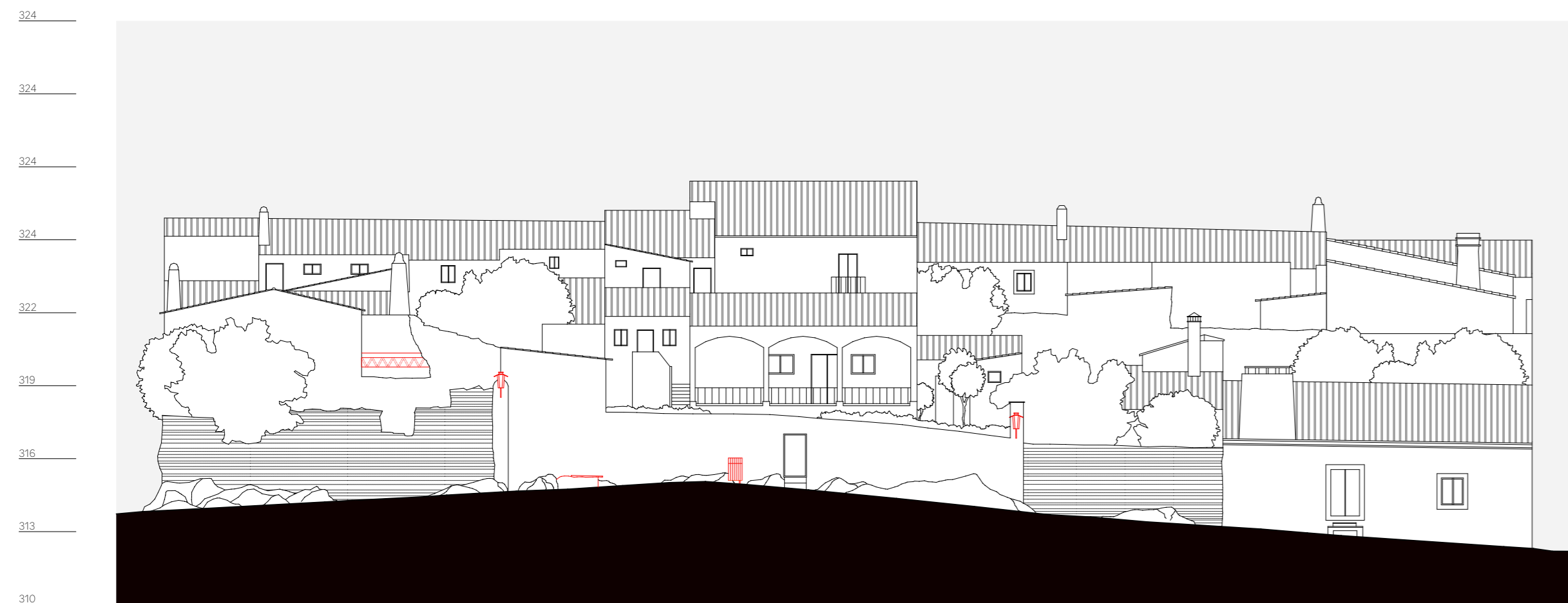
quarteirão K, alçado 1, rua de santiago n. 2 - 5