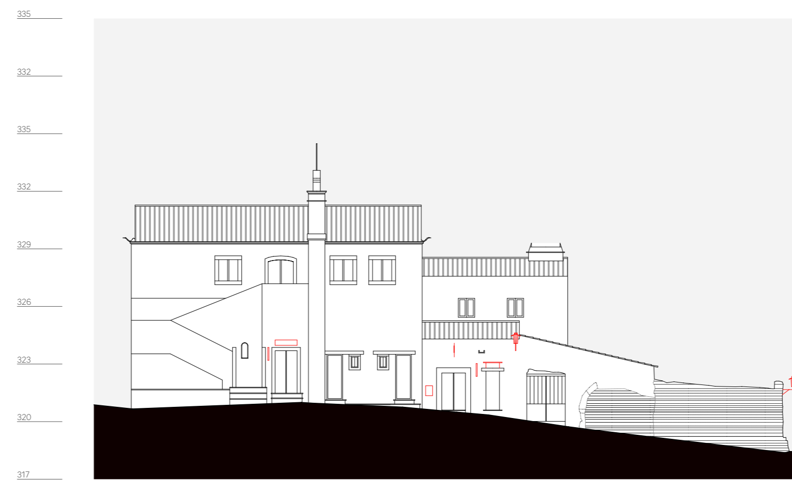
quarteirão R, alçado 2, travessa da cadeia n. 1 a 9