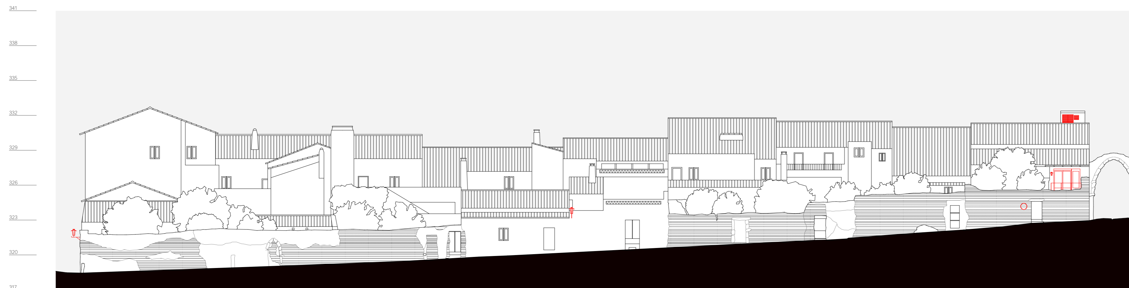
quarteirão R, alçado 4, rua das videiras n. 2 a 14