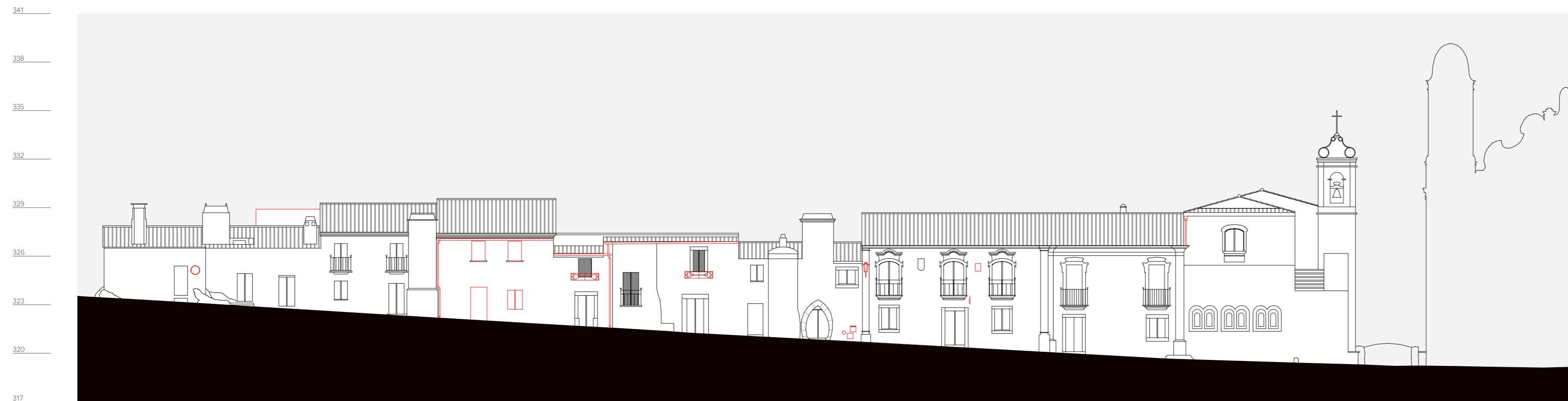
quarteirão R, alçado 3, rua direita n. 2 a 22